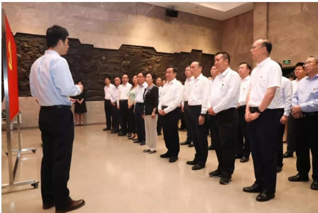
瞻仰中共四大纪念馆