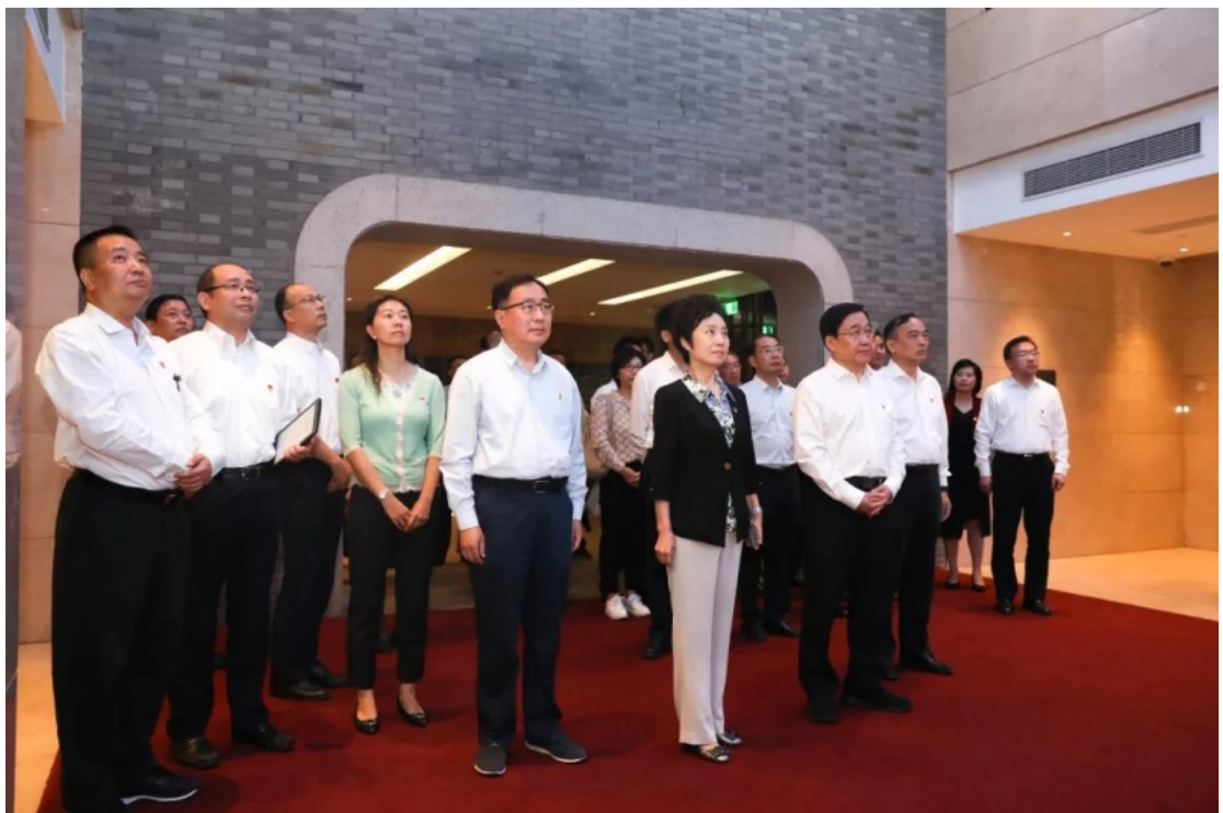
瞻仰中共二大会址